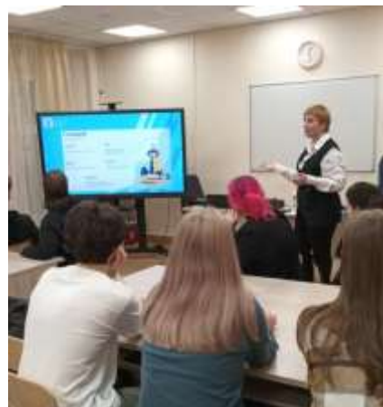
Педагог - Обучающийся