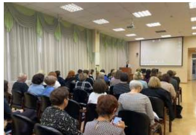
Работодатель - Педагог