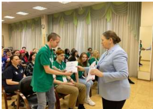
Работодатель - обучающийся