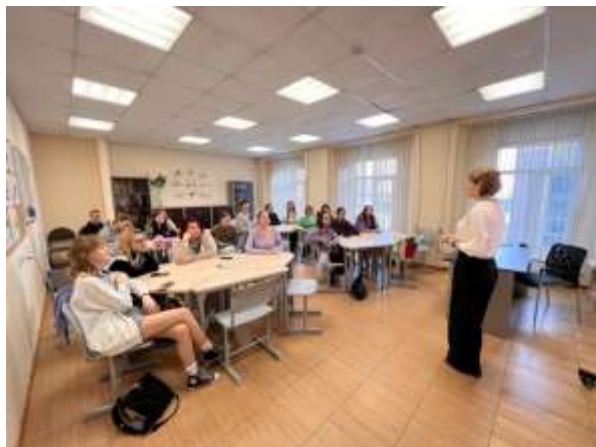
Обучающийся – Обучающийся