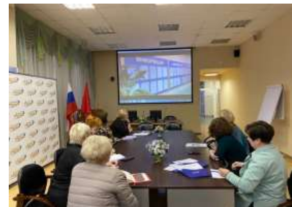
Педагог - Педагог